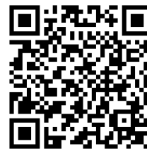
申込サイト QR コード

申込サイト URL: https://sec.tobutoptours.co.jp/web/evt/2025alljapan-judo/